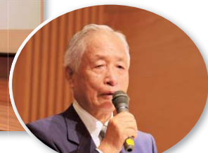
▲挨拶する小長同窓会長