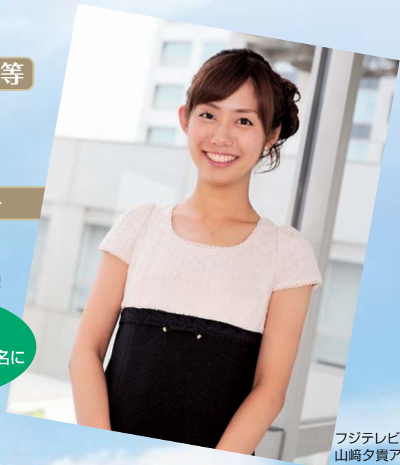
フジテレビ 山崎夕貴アナウンサー