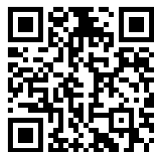
↑ 岡山大学 アクセスマップ