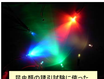
昆虫類の誘引試験に使ったLEDから発する様々な光