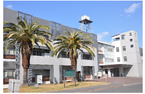
岡山大学 アクセスマップ