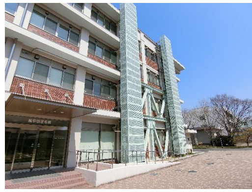
岡山大学 アクセスマップ