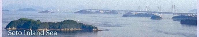
Seto Inland Sea

WPI Immunology Frontier Research Center, Osaka University, Japan