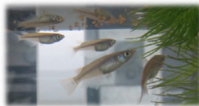
餌を食べる メダカ

本研究グループでは、さまざまな味覚受容体についてスクリーニングを実施。ヒトの受容体をはじめほとんどの味覚受容体が実験室では適切に生産できない一方、解析した中では唯一、メダカの T1r2・T1r3 ヘテロ二量体味覚受容体の細胞外領域が、昆虫培養細胞を用いて適切に生産できることを発見しました。この精製タンパク質を用いて解析を行った結果、T1r2・T1r3 ヘテロ二量体細胞外領域が、メダカが好む味物質であるアミノ酸を数 \mu\text{M} ~数百 \mu\text{M} の濃度域で結合すること、この結合に伴い、細胞外領域が広がった状態からコンパクトな状態に構造変化することを解明しました（図1）。また、類似した他の受容体では、二量体を構成するタンパク質分子が単独で構造変化するパターンと、二量体の相互作用様式が変化するパターンの2種類の構造変化のパターンが報告されていましたが、今回観察された味覚受容体細胞外領域の構造変化は、二量体の相互作用様式が変化するパターンであると考えられることがわかりました（図2）。受容体の残り3分の1を占める膜貫通領域や細胞内領域に構造変化が伝播して、細胞の外で起こった味物質結合の情報が細胞の中に伝えられると考えられます。