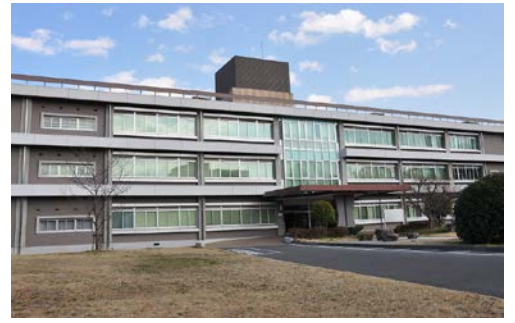
岡山大学 アクセスマップ