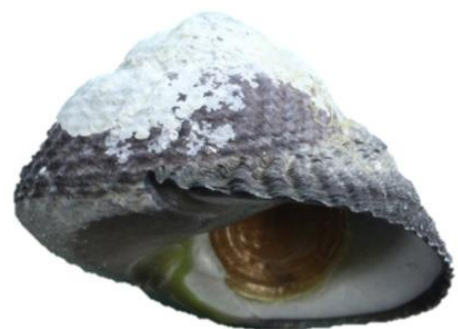
図2. バテイラ属の種のDNA塩基配列に基づく系統樹（抜粋）。クマノコガイとクサイロクマノコガイが同一のまとまり（単系統群）とはなっていないことに注意。右はヤマタカクボガイ。