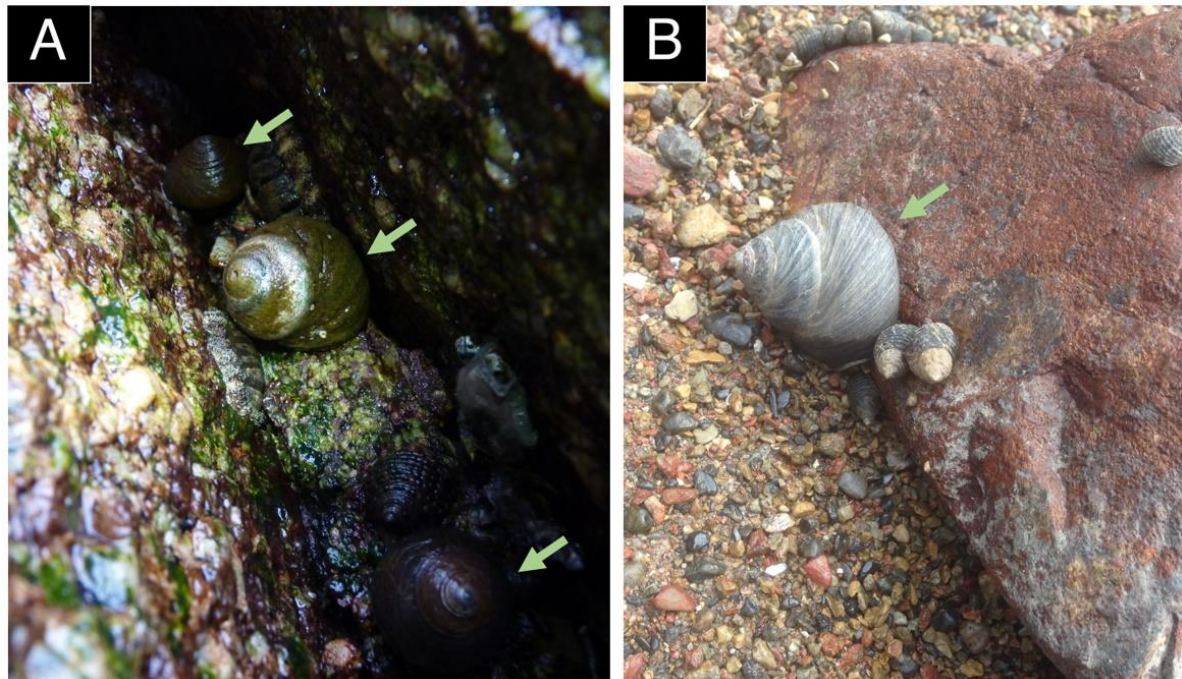
図 3. 野外におけるクサイロクマノコガイの生貝（緑矢印）。A: 香川県坂出市（瀬戸内海）、B: 鹿児島市（錦江湾）。