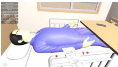
(c) ベッド廻りを清拭している様子