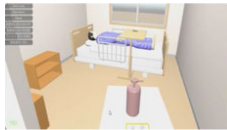
(b) ワゴンを押して病室内に入っていく様子