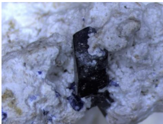
図 1：天然の逸見石結晶

この発見は、稀少さのために磁性研究の舞台に上がることが少なかった「日本産新鉱物」に注目するという、新しい視点を持った研究です。今後、日本産新鉱物の多様性に注目することで、驚くような物理現象の発見が期待されます。