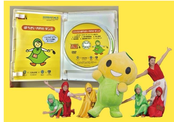
DVD・CD パッケージ教材

これまでの主な活動としては、防災ダンスの開発や、それらを幅広い地域に広めるために、CD・DVD の作成や教育現場で実際の教員に授業の中で実施していただけるように、指導書や子どもたち向けのリーフレットなども作成しています。また幼稚園から大学までの各学校現場で防災ダンスを用いた防災教育を実施しており、さらに多世代が集まる場である大型商業施設では、「授業中に突然地震が発生する」といったシナリオを設定し、単に防災ダンスを踊るのではなく、観客と一緒に防災ダンスを実施するなど双方向の取り組みも行っています。