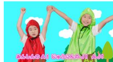
映像教材アクセス QR コード