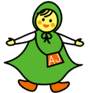
あんしんの森の住人 AJ