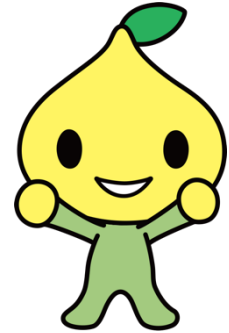
こくみん共済 coop 公式キャラクター ピットくん

岡山県を襲った西日本豪雨をはじめ、日本全土で大規模な自然災害が多発しており、地域の防災力を向上させる必要性が高まっています。一方、現代においては家族形態が変化し「地域のつながり」が薄れ、更には新型コロナウイルスのパンデミックにより一層深刻化しており、災害時に家族以外と共に助け合う「共助」を困難にしています。これを受けて、本学の学生がこの課題を解決するために「共助」の土台となる地域活性化に寄与できる防災教育教材の必要性を強く感じたことが開発のきっかけです。