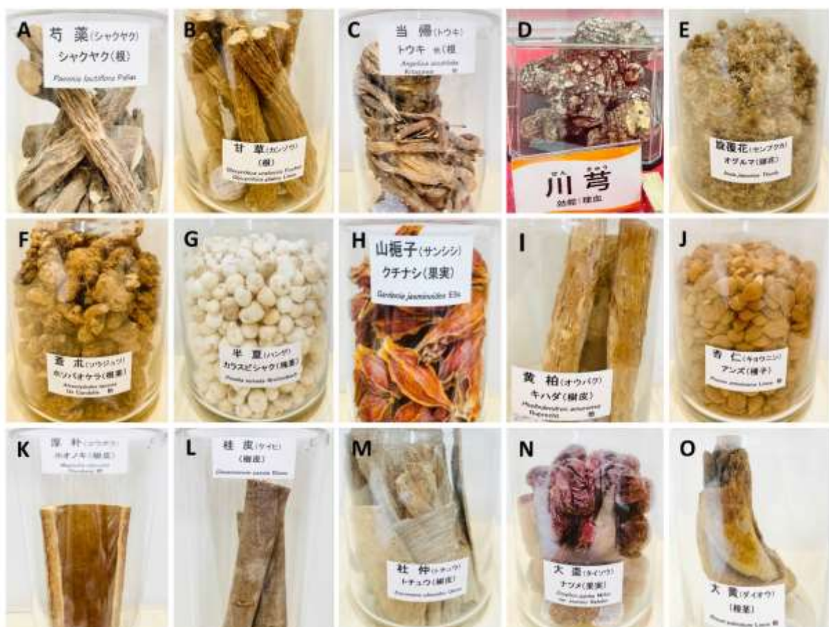
図 1. 日本の薬局で売られている漢方薬に含まれる素材の一例

鑑真和上は日本に戒律を伝えたことで有名ですが、同時に漢方薬をもたらし、その素材の見分け方や処方を当時の弟子たちに教えています。