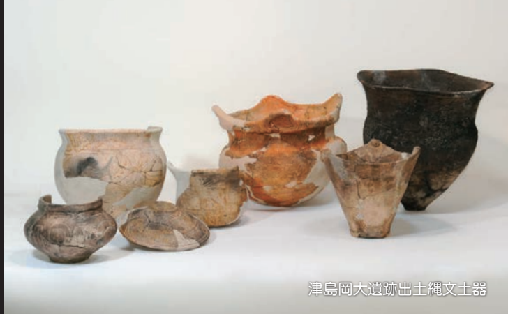
津島岡大遺跡出土縄文土器