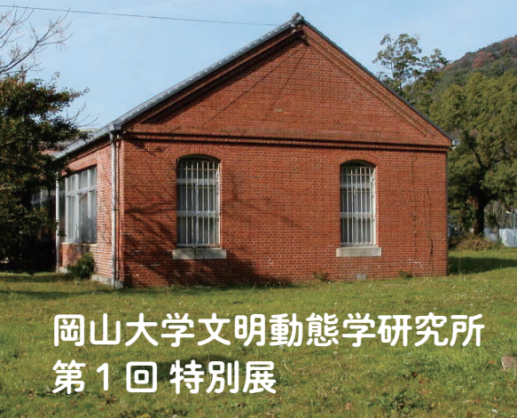
旧陸軍赤レンガ建物（津島キャンパス）