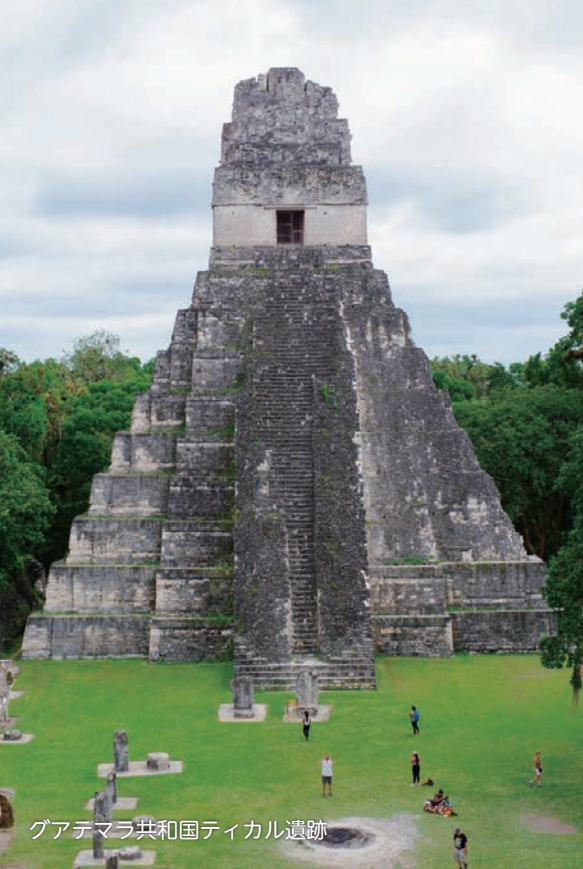
グアテマラ共和国ティカル遺跡