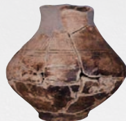
津島岡大遺跡出土 文明動態学研究所蔵

縄文時代から近代にかけての津島の歴史を、40年間蓄積された発掘調査成果をもとに復元します。津島一帯の遺跡から出土した資料も盛りだくさんです。