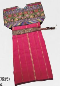
マヤ系先住民民族衣装（現代） BIZEN 中南米美術館蔵

世界史上でも有数の凄惨な侵略戦争であったスペインによる古代マヤの征服。その戦争を経てもマヤ文化は絶えることなく現代も息づいています。BIZEN中南米美術館などの協力による美しい展示品とともに、その始まりから隆盛の歴史の概略を紹介します。