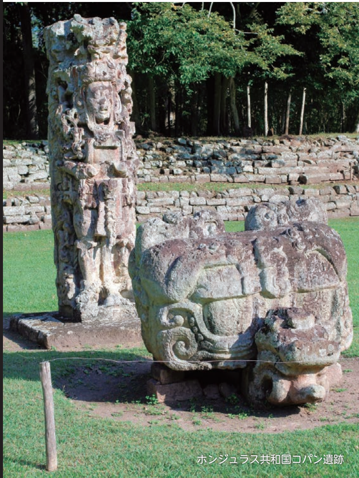
ホンジュラス共和国コパン遺跡