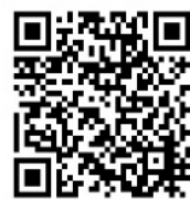
岡山大学 公開講座HP