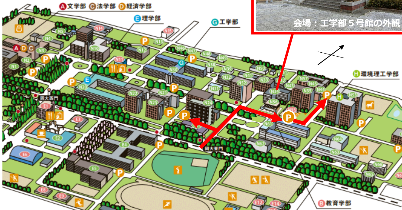
会場：工学部5号館の外観