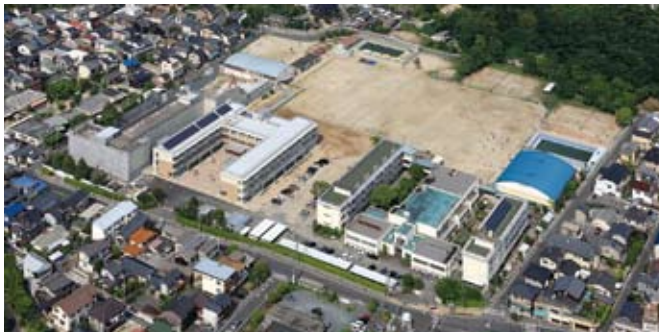
教育学部附属幼稚園・小学校・中学校