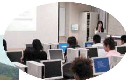
図書館利用者ガイダンス