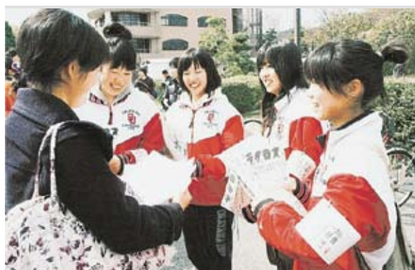
▲カルト対策のため義務付けた腕章をして新入生を勧誘するサークルのメンバー

合が多いため、公認サークルに腕章の着用を義務付けることで、学生がカルトに勧誘されることを未然に防ぐことができます。画期的な対策としてメディアでもとりあげられました。昨今、カルト系団体の活動が活発化しています。不審な団体の勧誘にはくれぐれも注意してください。