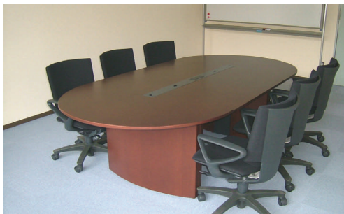
法律相談が行われるリーガルクリニック室

*当日は、ご予約時間5分前までに法律相談室受付（裏面地図参照）にお越しください。