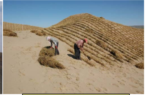
砂丘固定と緑化(中国)