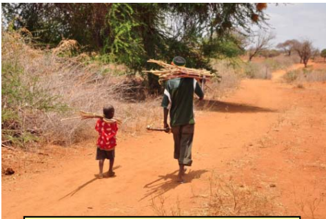
乾燥地での木材需要(ケニア)

冬が終わり、新緑が心を浮き立たせようとする時期に、大陸からやってくる黄砂は実に鬱陶しく、腹立たしいものです。この細かく黄色い砂粒は中国の北部からモンゴルにかけての乾燥地から強い季節風に乗ってやってくるのですが、その発生量は大陸の大地を吹きすぎる風の強さだけでは決まりません。黄砂を生み出す地域の生態系の劣化(砂漠化)が重要な要因となっています。乾燥地がどんなところで、そこで何が起こっていて、どんなことを考えながら対策を講じなければならないのかなど、みなさんにはあまりなじみのない環境の不思議を紹介します。