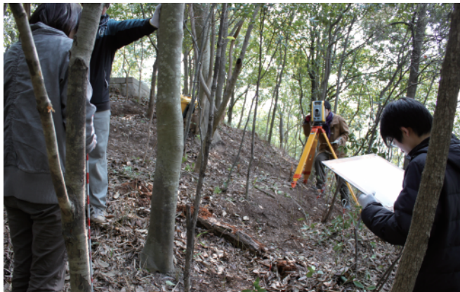
トータルステーションによる等高線測量