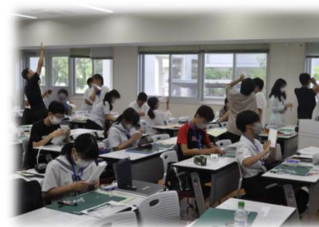
作った分光器で色々な光を観察

STEP 3 生徒が研究研究者が伴走 STEP 2&2.5を経た受講生のうち更に探究を深めたい者が、個に応じて、無理のない範囲で大学や研究施設や個別のフィールド等を活用しながら探究に取り組む。エージェンシーを養えるよう、生徒自身が探究のデザインを練る経験を大切にする。 研究者と議論する機会を設けながら探究を深化させる 。対象生徒数：2年目以後で 毎年5人程度 を想定(1年目の状況によって判断) 最後のポスターセッションなどから