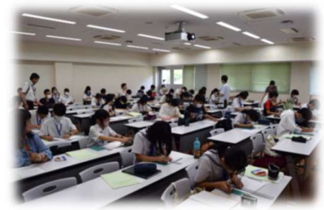
回折格子を使った分光器作成