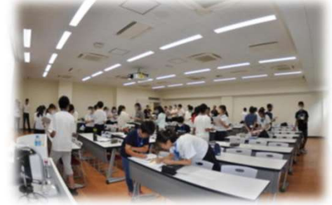
受講者相互の自己紹介