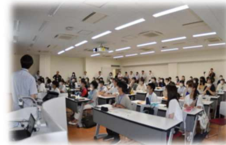
開講式での受講生と保護者への説明