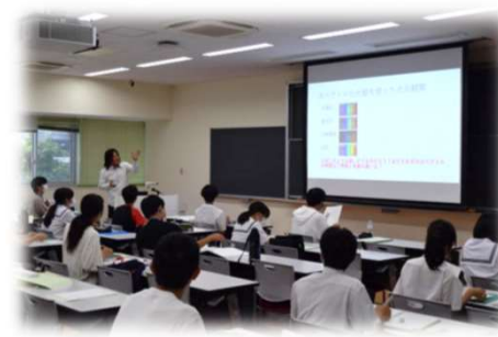
第1回講座 工作と数値処理