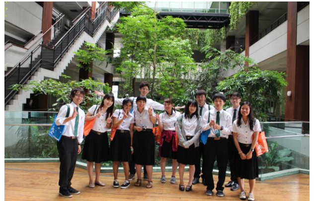
タイ国カセサート大学・バンケンキャンパスにて

夏季休暇中(タイ、日本で各2週間)、2年生を対象に「GP 特別コース」を開講しました。タイ国のカセサート大学では、2014年度は7月28日～8月10日にかけて実施されました。期間中、岡山大学環境理工学部の学生6名はカセサート大学の学生5名とともに天然資源や環境問題を考えるうえで重要となる環境経済学や環境保全活動の実践教育を受けました。また、岡山大学環境理工学部においても同様に、8月24日～9月6日の期間、両国の学生は「人間活動と水環境」をテーマに講義演習を受けました。