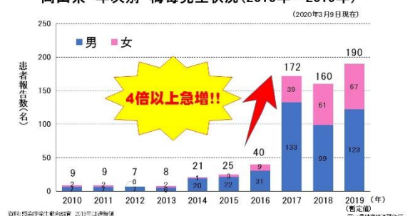
岡山県 年次別 梅毒発生状況(2010年～2019年)

日本国内で梅毒が急増していますが、岡山県は特に急増しています。2019は人口100万人あたりの報告数は東京都・大阪府に次いで全国第3位でした。女性では20代が45%を占め最も多く、感染経路はパートナーからが59%です。HIV（エイズウイルス）感染も横ばい状態です。