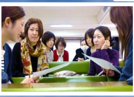
各種のグループワーク