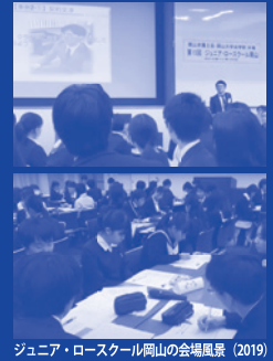
ジュニア・ロースクール岡山の会場風景 (2019)

刑罰を科すことの意味。皆さんは考えたことがあるでしょうか。今回は居眠り運転の末、交通事故を起こした被告人に対して刑罰を科す意味を考えます。私たちは常に犯罪と隣り合わせの世界に生きています。いつどこで被害者に、はたまた被告人になるかは分かりません。そのことを意識しつつ、皆さんの想像力を最大限に生かしながら被告人に科すべき刑罰について、一緒に考えてみましょう。