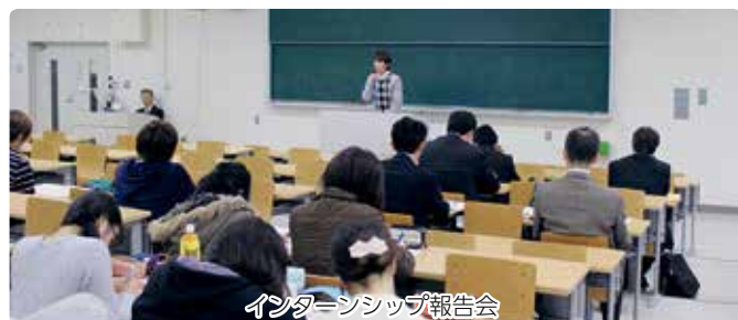
インターンシップ報告会

夏季休暇を利用して実施される民間企業、行政官庁、弁護士事務所などでの「就業体験実習」（インターンシップ）は、職業への認識を深める最適の経験となります。またこれは、法学部の正規の授業科目となっています。学内では、就職活動ガイダンス、企業・官公庁説明会、公務員試験・法科大学院試験対策講座などのサポートも利用することができます。