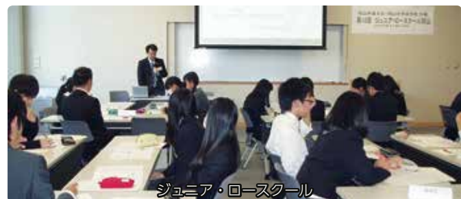
ジュニア・ロースクール

中高校生の「法に関する学習（法や規範の意義及び役割、司法制度の在り方）」を支援する活動を岡山弁護士会と協力して実施しています。法学部生も教材づくりやチューターとしてグループ討議で助言をしています。法学部生にとっても大学で学んだ法的知識を応用・活用する能力やコミュニケーション能力と問題解決能力を高める機会となっています。