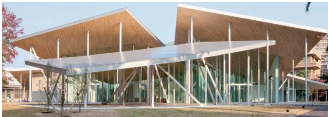
Junko Fukutake Hall (Jホール) (岡山大学鹿田キャンパス内) 〒700-8558 岡山市北区鹿田町2丁目5番1号