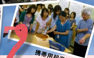
携帯用超音波装置