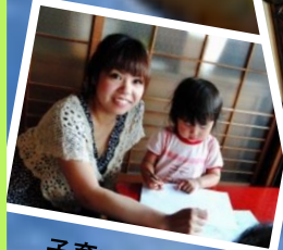
子育て広場で学ぶ