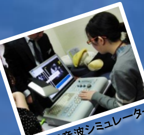
超音波シミュレーター

2015年11月16日(月)～2016年1月15日(金) 募集要項 (2015年10月30日(金)掲載予定) ホームページ、教務グループ担当(下記) より入手可能