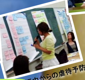
妊娠中からの虐待予防