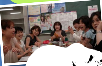
各種の グループワーク