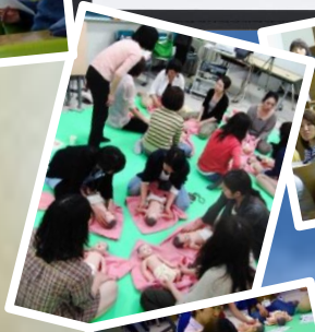
ベビー マッサージ