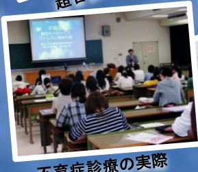
不育症診療の実際