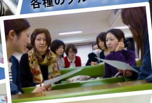
各種のグループワーク