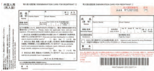
ပြန်လည်ပြည်ဝင်ခွင့်ပြုရန်ကဒ်

ဂျပန်နိုင်ငံမှ ထွက်ခွာချိန်တွင် နေထိုင်ခွင့်ကဒ်ကို သေချာစွာ တင်ပြကာ၊ ဂျပန်နိုင်ငံပြန်ဝင်ထွက်ခွင့်အတွက် သုံးသော ED ကဒ် ပေါ်တွင် ဂျပန်နိုင်ငံပြန်ဝင်ခွင့်အထူး ခွင့်ပြုချက်စနစ် ဖြင့် ဂျပန်နိုင်ငံမှ ထွက်ခွာခြင်းဖြစ်ကြောင်း သင့်ရည်ရွယ်ချက်ကို ဖော်ပြသည့် ကော်လံတွင် အမှန် အမှတ်အသား ခြစ်ပါ။