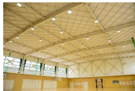
■ 内観 (アリーナ天井)