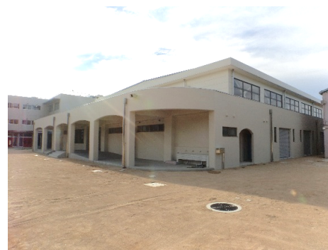
■ 外観 (南東面)