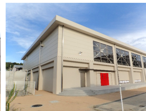
■ 外観 (北西面)