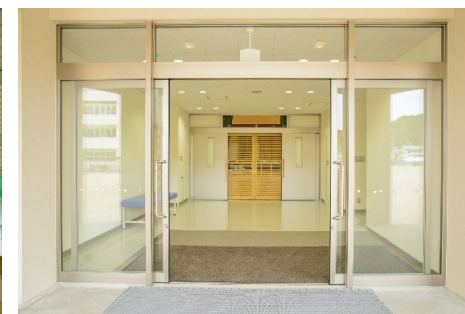
■ 内観 (玄関ホール)