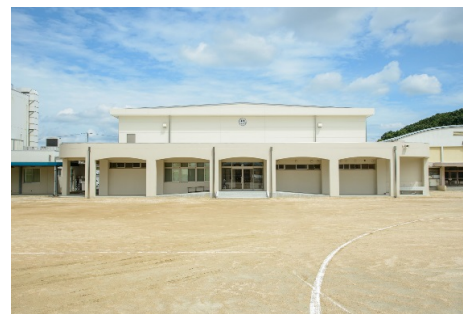
■ 外観 (南面)