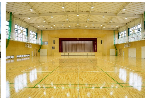
■ 内観 (アリーナ)