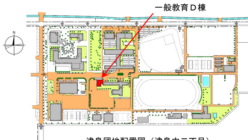
津島団地配置図 (津島中二丁目)