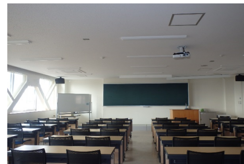
内観 (4Fマルチメディア講義室)