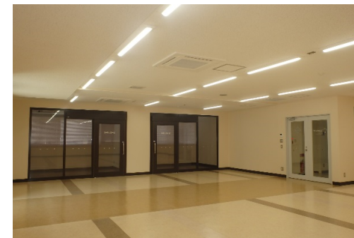
内観 (2Fグローバル学修室)