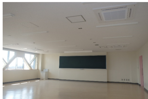
内観 (3F双方向遠隔連携講義室)