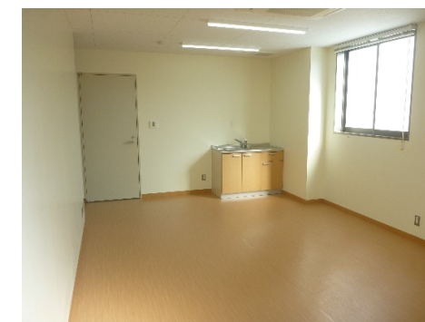
内観（ミーティング室）