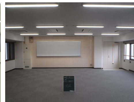
■ 内観 (講義室)