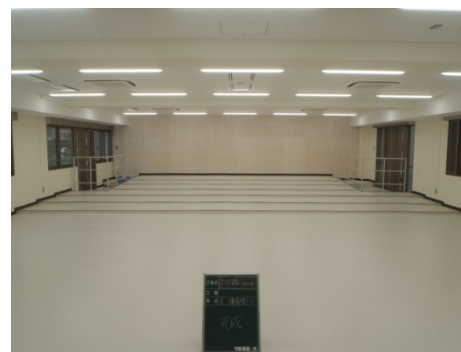
■ 内観 (講義室)