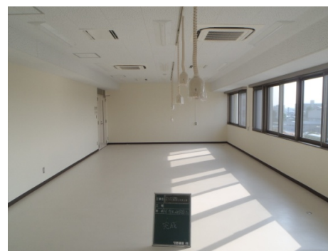
■ 内観 (院生研究室)