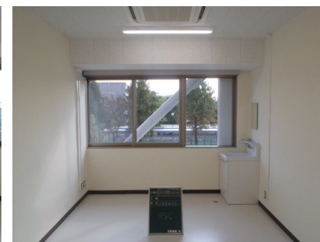
■ 内観 (教員研究室)