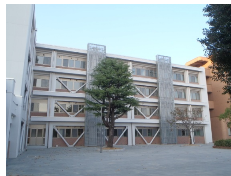
■ 外観 (南面)