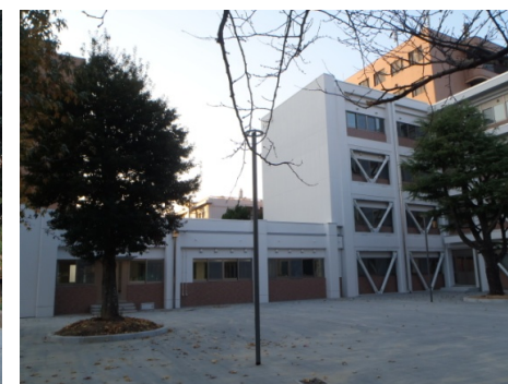
■ 外観 (東面)