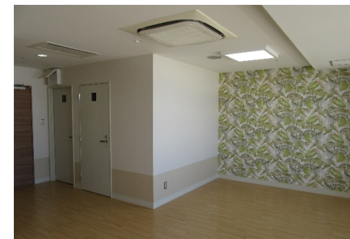
■ ファミリールーム(3)