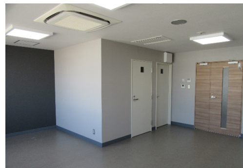
■ ファミリールーム(1)