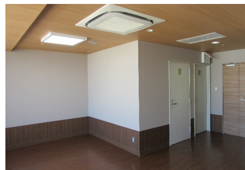
■ ファミリールーム(5)