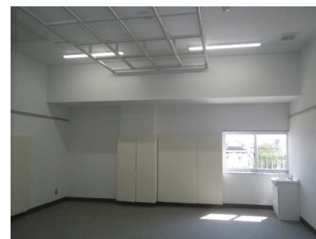
内観 小・中学部 (2F自立活動室)