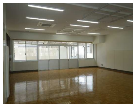
内観 小・中学部 (1F多機能型プレイルーム)