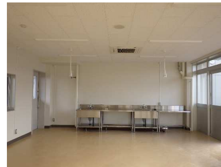
内観 高等部 (1Fフレキシブル作業室)