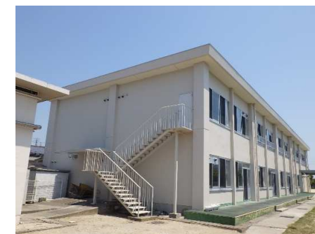
外観 小・中学部校舎棟 (南西面)