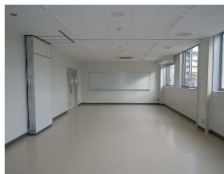
内観 高等部 (1F多目的ホール)