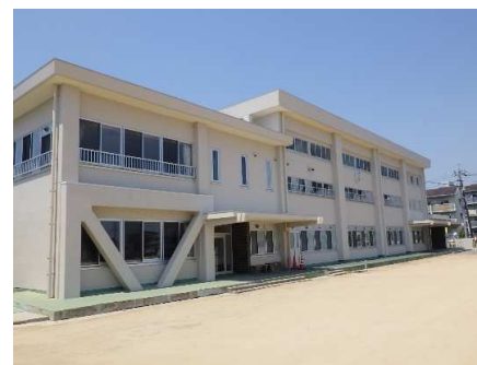
外観 小・中学部校舎棟 (東面)