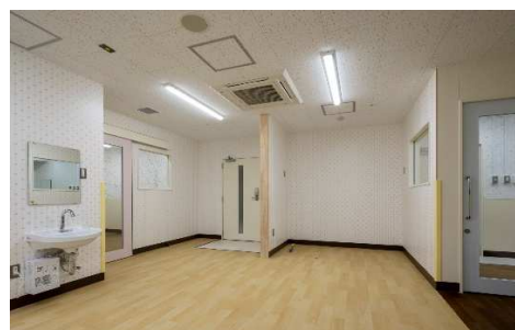
■ 内観 (3F 病児保育ルーム)