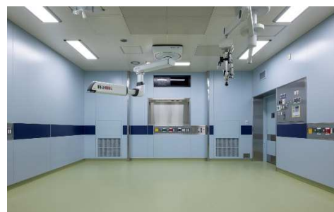
■ 内観 (3F OP 2)