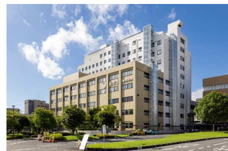
■ 外観 (北西面)