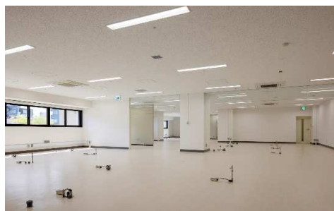
■ 内観 (2F 総合診察室)