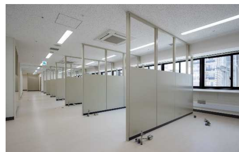
■ 内観 (2F 歯科診察室)