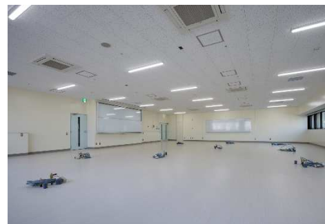
■ 内観 (4F シミュレーション実習室)