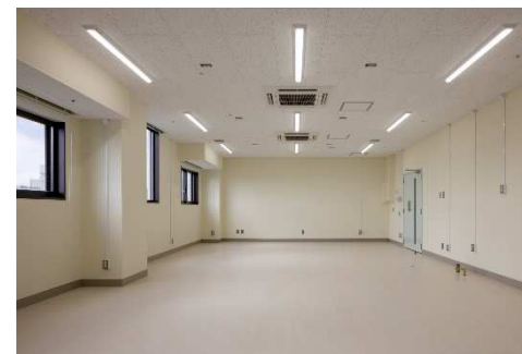
■ 内観 (8F ケミストリーcommons)