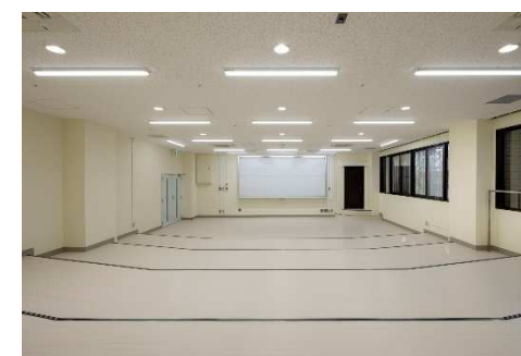
■ 外観 (4F 電子講義室)