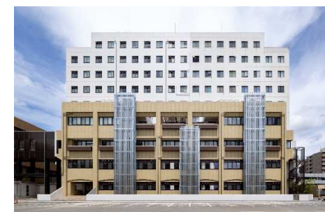
■ 外観 (南面)