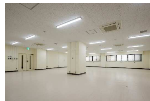
■ 外観 (B1F 演習室)