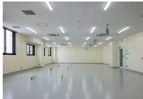
■ 外観 (9F リサーチスペース)