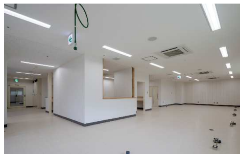
■ 内観 (1F 歯科診察室)