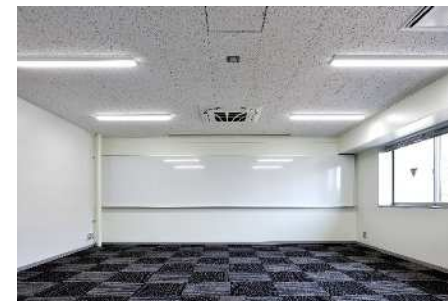
■ 内観 (4F遠隔講義スタジオ)