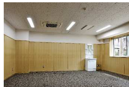
■ 内観 (1F法教育地域連携室)