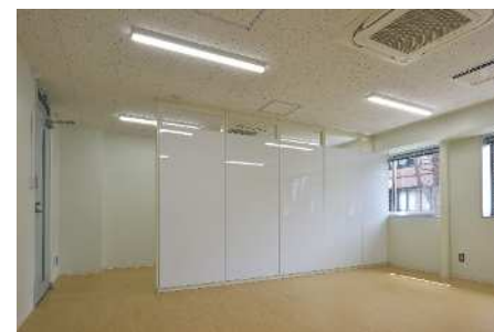
■ 内観 (2F教育研究支援室)