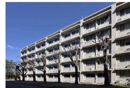
■ 外観 (南面)