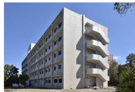
■ 外観 (北西面)