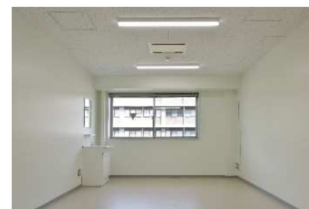
■ 内観 (3F教員室)