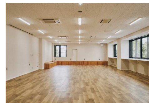
■ 内観 (2F フirstステージスペース)