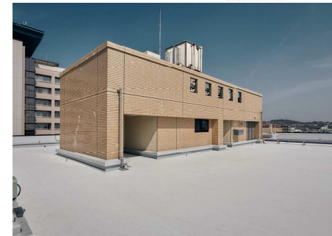
■ 外観 (屋上)