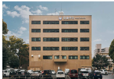
■ 外観 (北面から)