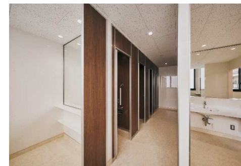
■ 内観 (女子トイレ)