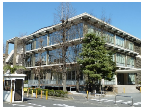
■ 外観 (南西面)