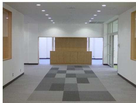
■ 内観 (1階ホール)