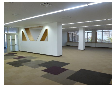
■ 内観 (2階自主学習スペース)