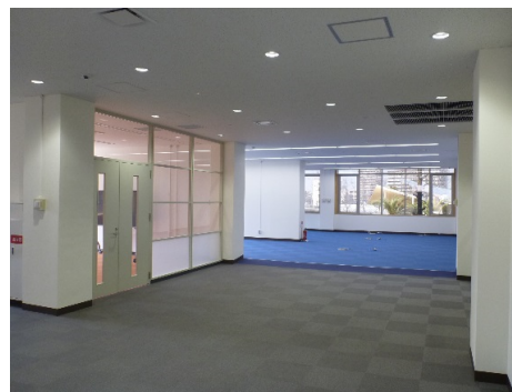
■ 内観 (2階ホール)