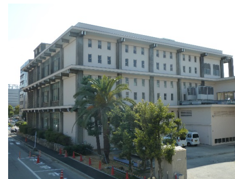
■ 外観 (北東面)