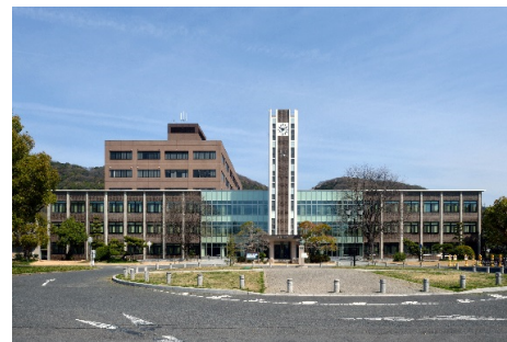
■ 外観 (南面)