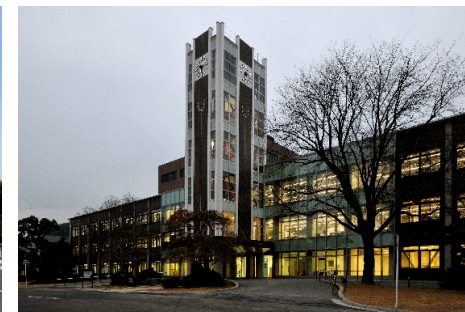
■ 外観 (南東面)