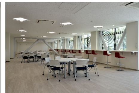
■ 内観 (1階アメニティコーナー)