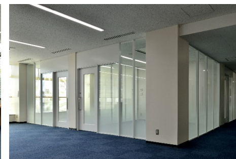
■ 内観 (3階学習個室)