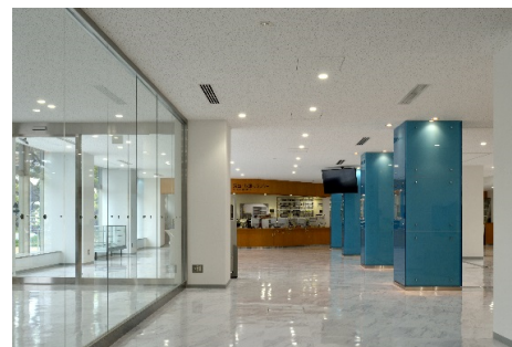
■ 内観 (1階ホール)