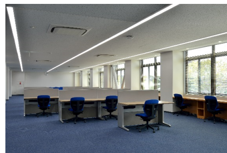
■ 内観 (3階閲覧室)