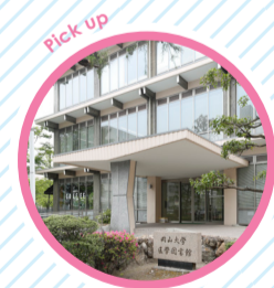
18 岡山大学図書館 [鹿田分館]