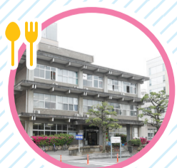
23 医学部記念会館 1階カフェテリアは来学者(保護者含む) 休憩場所を兼ねます。 8/8,9 8:00~14:00 1階カフェテリア営業時間 8/8,9 12:00~13:30