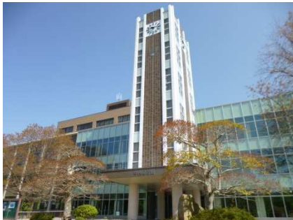
岡山大学附属図書館

※他に、建物入館などに使用する学部があります。詳しくは、各学部でお聞きください。