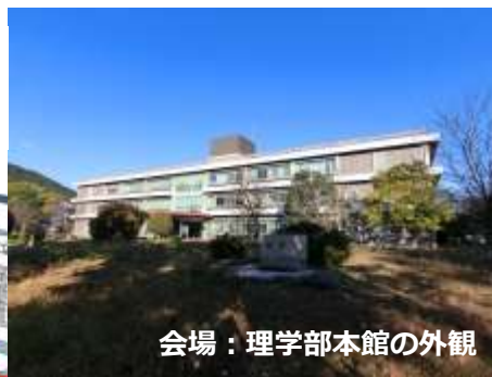
会場：理学部本館の外観