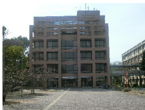
文化科学系総合研究棟