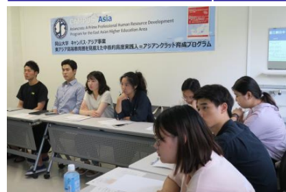
〈 東アジア・リーダーシップ論:学生フォーラム 〉

キャンパスアジア修了要件を設定し、共通科目として東アジアリーダーシップ論を開講、また、大学院レベルでの英語による学習に対応できる体制を整えた。薬学系において、共同研究を基盤とする博士学位ダブルディグリー・プログラムを開始した。