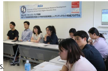
〈 Leaderships in the East Asia region: Student Forum〉