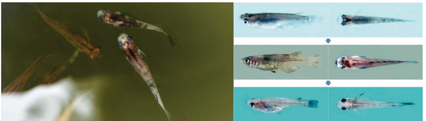
図4 高知県南国市で採集した野生メダカから作られた褪色メダカ