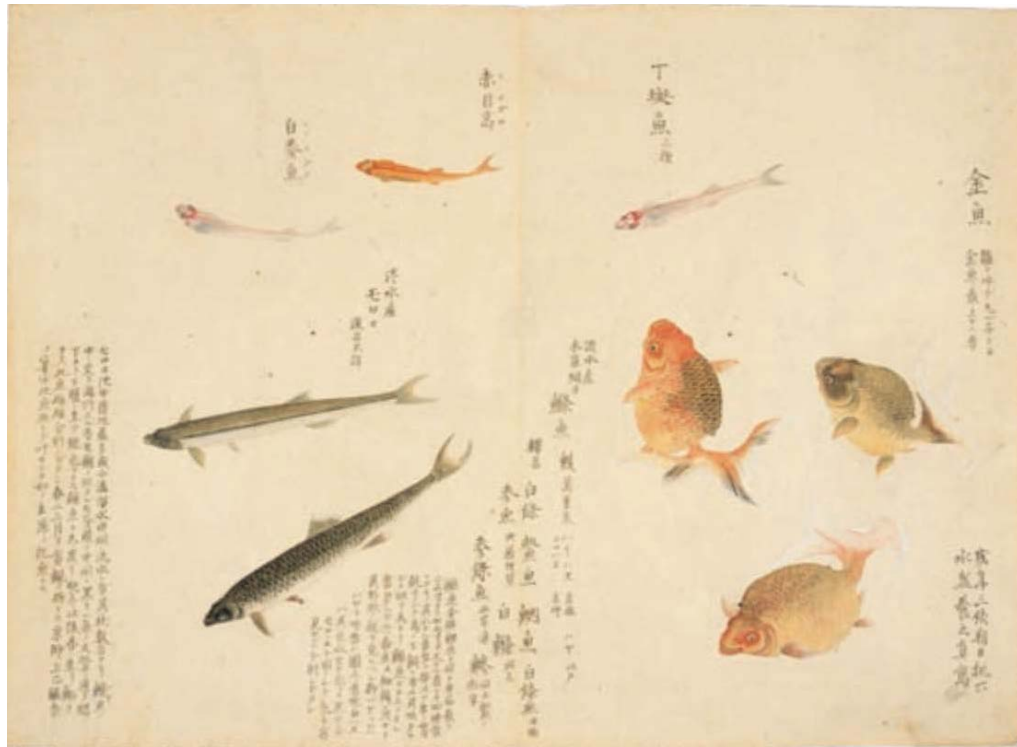
図1 梅園魚譜（毛利梅園作） 国立図書館デジタルコレクションより