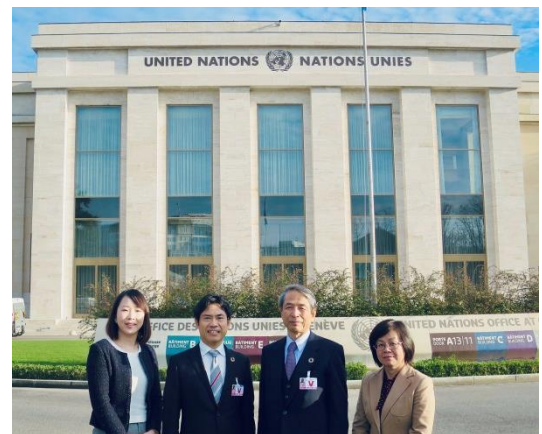
国連ジュネーブ事務所での記念撮影